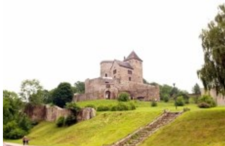
Zamek przed rekonstrukcją