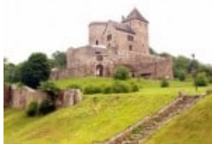
Zamek przed rekonstrukcją