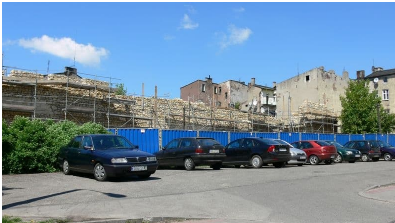
Na Modrzejowskiej prawie ukończono parking vis-a-vis hal oraz trwa budowa budynku mieszkalno-usługowego na tyłach Kauflanda.