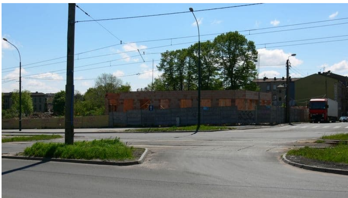
Mury miejskie na Zawalu już prawie stoją.