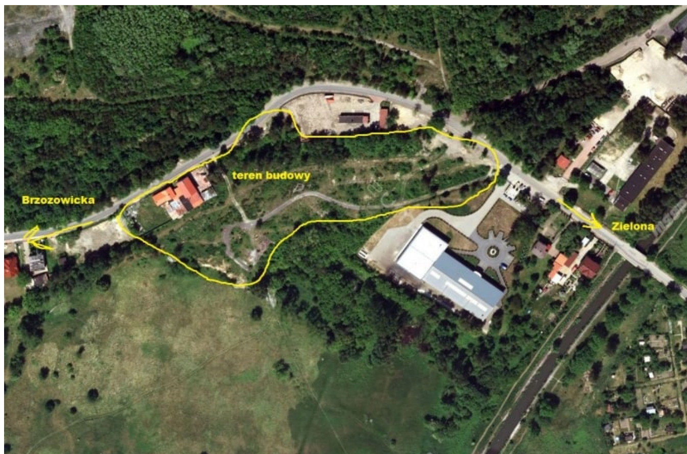
Lokalizacja budowy osiedla

Przedstawiam fotoreportaż z budowy nowego osiedla domów wielorodzinnych przy ulicy Brzozowickiej (jadąc trasą w kierunku Zielonej). Mimo, iż to niedaleko centrum - natknąłem się na ta budowę w sumie przez przypadek. Inwestycje w Będzinie słyną raczej z tego, że pokazują się nagle i stąd moja spóźniona relacja z tej budowy. Osiedle po wstępnej, wzrokowej analizie, wygląda na mieszany typ zabudowy: szeregowy i wielorodzinny. Domów wolnostojących nie zauważyłem. Autorem projektu jest miejscowa pracownia WSK PROJEKT , a developerem i zarazem generalnym wykonawcą spółka z o.o. "POZYTYW" z Będzina (o której pierwszy raz słyszę, niestety nie posiadają żadnej strony w internecie, stąd wnioskuję, że została utworzona niedawno, na potrzeby tej inwestycji). Osiedle skalą przypominające podobne inwestycje na terenie miasta Będzina tj. Podskarpie czy Nowe Warpie. Lokalizacja - dość atrakcyjna - blisko bezpośredniego centrum miasta, tylko ta stara złomownia rozwała kontekst urbanistyczny pozamiejskiej sielanki. Zakład jest prawdopodobnie nieczynny (przynajmniej na taki wygląda), ale czy developerowi uda się przejść ten teren - nie wiadomo. Projektu na własne oczy na razie nie udało mi się jeszcze zobaczyć, najwyżej zamieszczę coś później, jeśli mi się poszczęści.