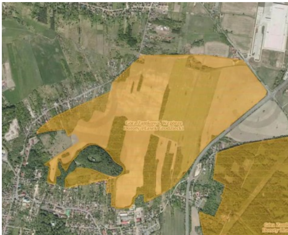
Obecny kształt obszaru chronionego krajobrazu „Wzgórze Doroty”.