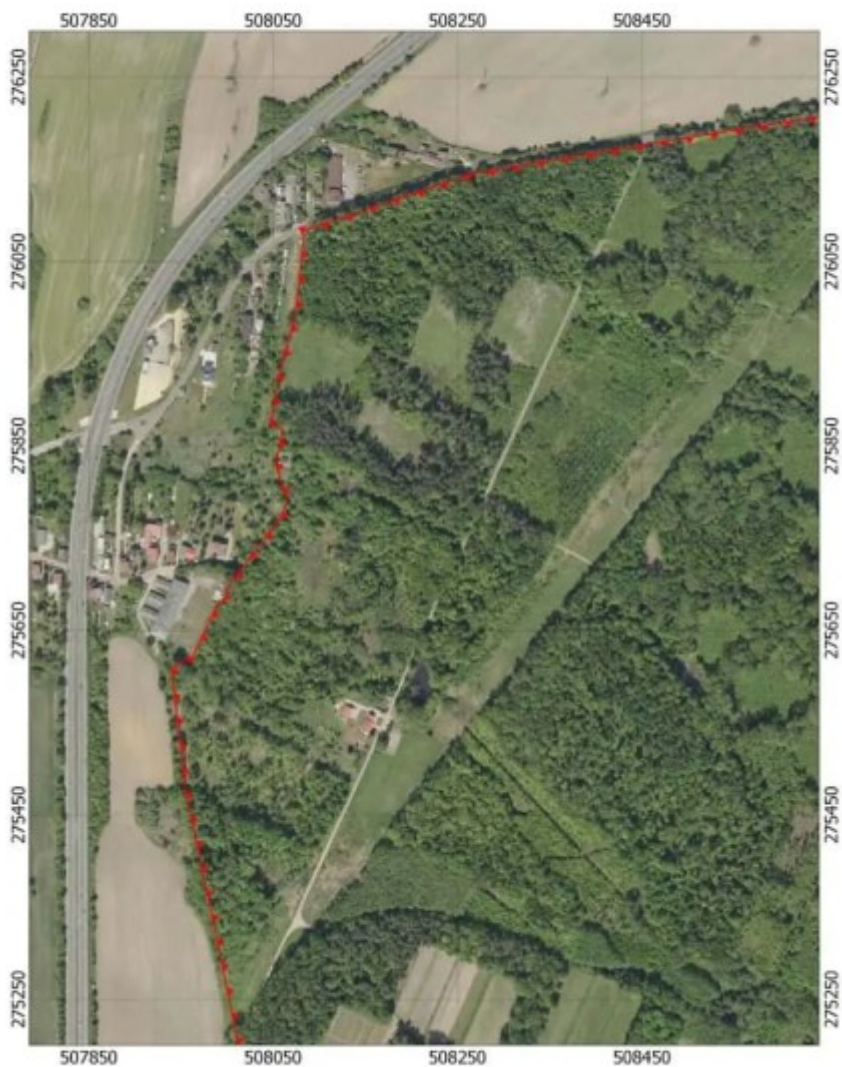
Przebieg granicy obszaru chronionego krajobrazu "Las Grodziecki" - arkusz 1/4