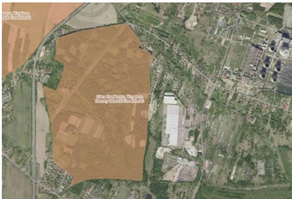
Granice obszaru krajobrazu chronionego Las Grodziecki - stan z uchwały z 1993 r.

§ 7. Uchwała wchodzi w życie po upływie 14 dni od daty ogłoszenia w Dzienniku Urzędowym Województwa Śląskiego.