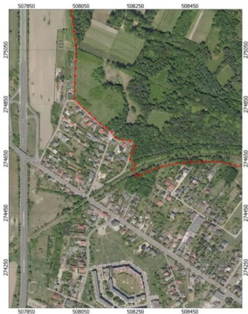
Przebieg granicy obszaru chronionego krajobrazu "Las Grodziecki" - arkusz 4/4