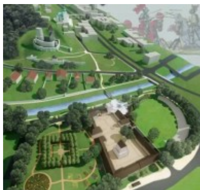
widok Wzgorza z lotu ptaka