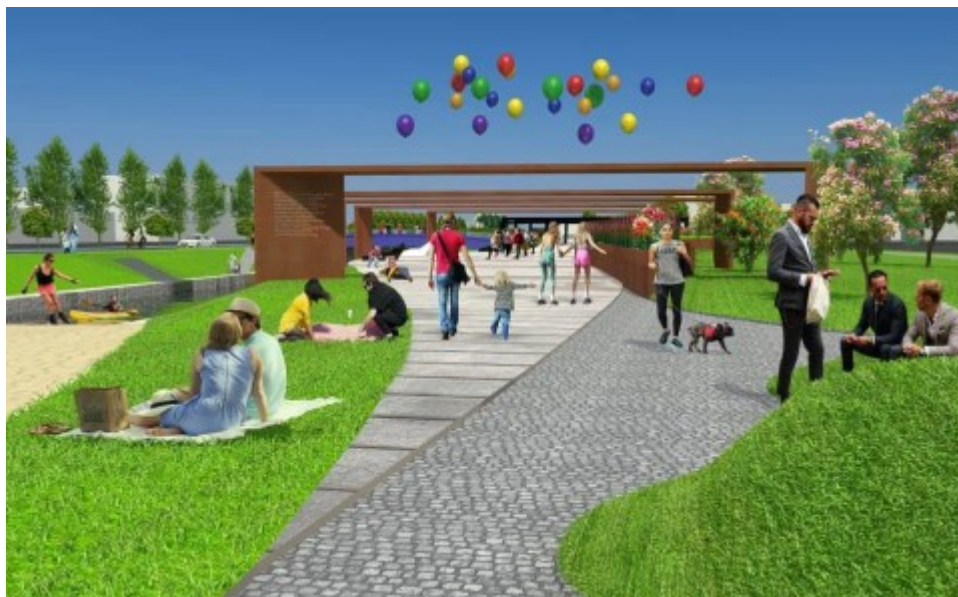
Autor: Rafał Lipiński

Pisząc o bulwarach nie można zapominać o hali sportowej, która ma w najbliższej przyszłości powstać w naszym mieście. Nasi siatkarze zmotywowani tym faktem uciekli w końcu ze strefy barażowej:). Kiedy dokładnie powstanie hala? Tego nie wiadomo. Miastu się spieszy, mam wrażenie że zbyt bardzo skupiono się na wbiciu pierwszej łopaty i to spowodowało, że I przetarg na zaprojektowanie i wybudowanie hali został 2 tygodnie temu unieważniony. Pojawiły się głosy w sieci, że w zaproponowanym terminie przez miasto Będzin hali się nie da po prostu wybudować. Finalnie okazało się, że oprócz czasu, miasto ma za mało pieniędzy na inwestycję, a najtańsza oferta jest droższa o prawie 2 miliony złotych. Co zrobi miasto? Nie wiem, zobaczymy. Mam swoje osobiste przemyślenia ale na razie nie będę ich prezentował publicznie. Czekam na ruch z naszej strony czyli władz Będzina.