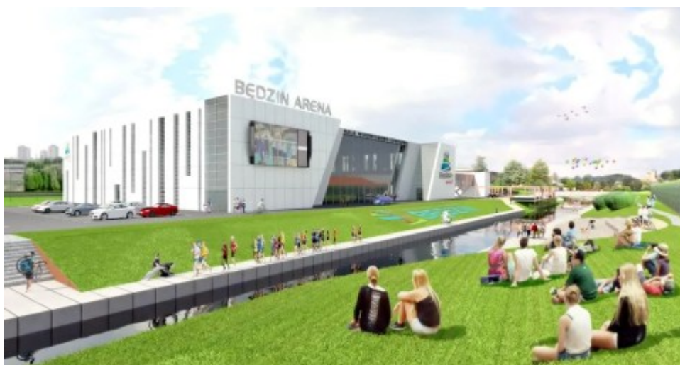
Autor: Rafał Lipiński

Pisząc o bulwarach nie można zapominać o hali sportowej, która ma w najbliższej przyszłości powstać w naszym mieście. Nasi siatkarze zmotywowani tym faktem uciekli w końcu ze strefy barażowej:). Kiedy dokładnie powstanie hala? Tego nie wiadomo. Miastu się spieszy, mam wrażenie że zbyt bardzo skupiono się na wbiciu pierwszej łopaty i to spowodowało, że I przetarg na zaprojektowanie i wybudowanie hali został 2 tygodnie temu unieważniony. Pojawiły się głosy w sieci, że w zaproponowanym terminie przez miasto Będzin hali się nie da po prostu wybudować. Finalnie okazało się, że oprócz czasu, miasto ma za mało pieniędzy na inwestycję, a najtańsza oferta jest droższa o prawie 2 miliony złotych. Co zrobi miasto? Nie wiem, zobaczymy. Mam swoje osobiste przemyślenia ale na razie nie będę ich prezentował publicznie. Czekam na ruch z naszej strony czyli władz Będzina.