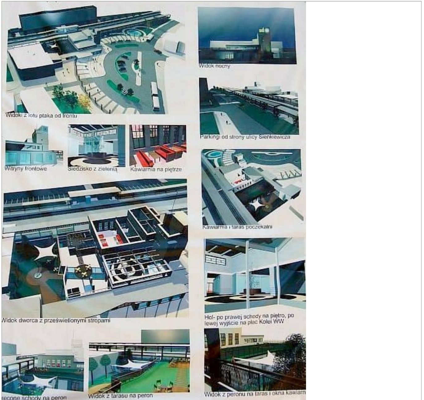
Zdjęcie 5 z 7