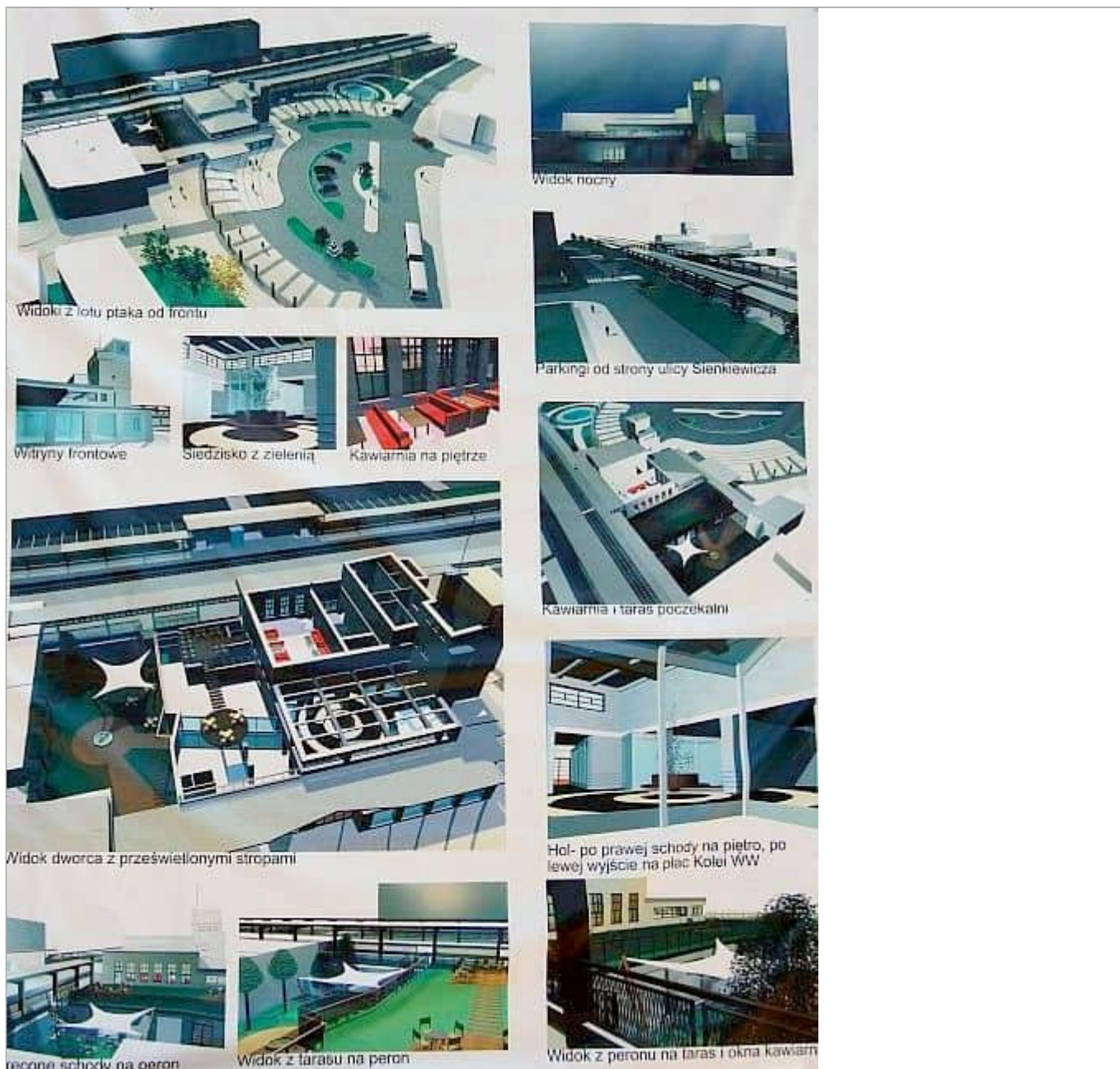
Zdjęcie 5 z 7