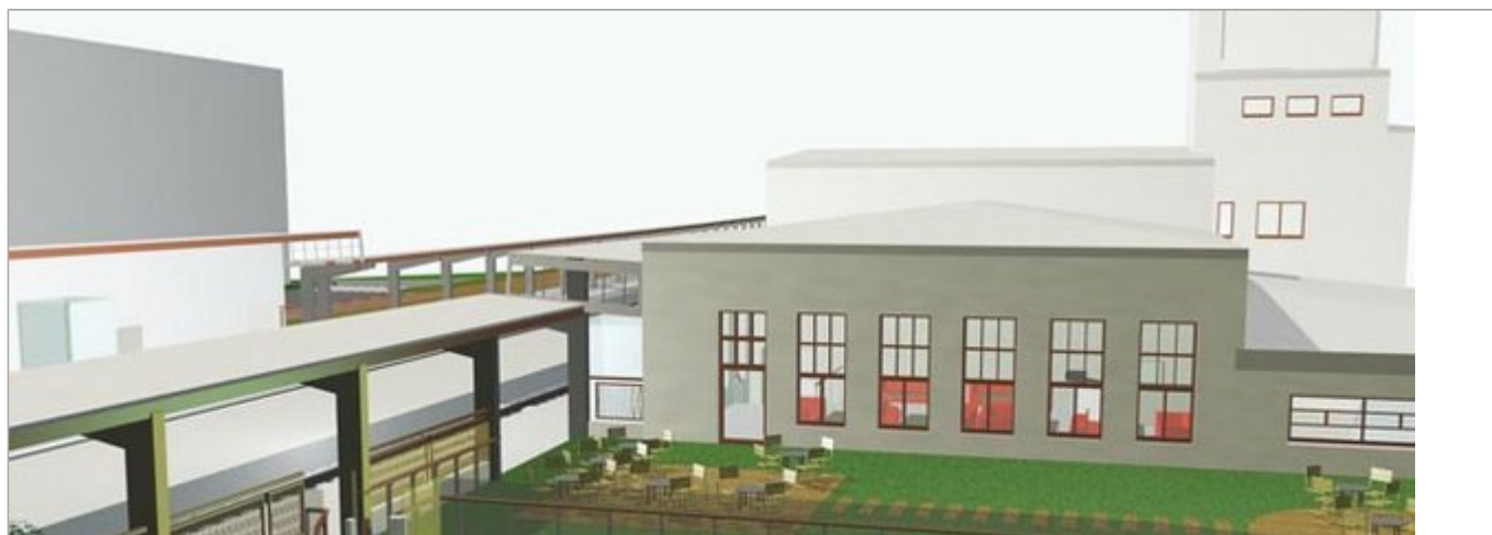
Zdjęcie 7 z 7