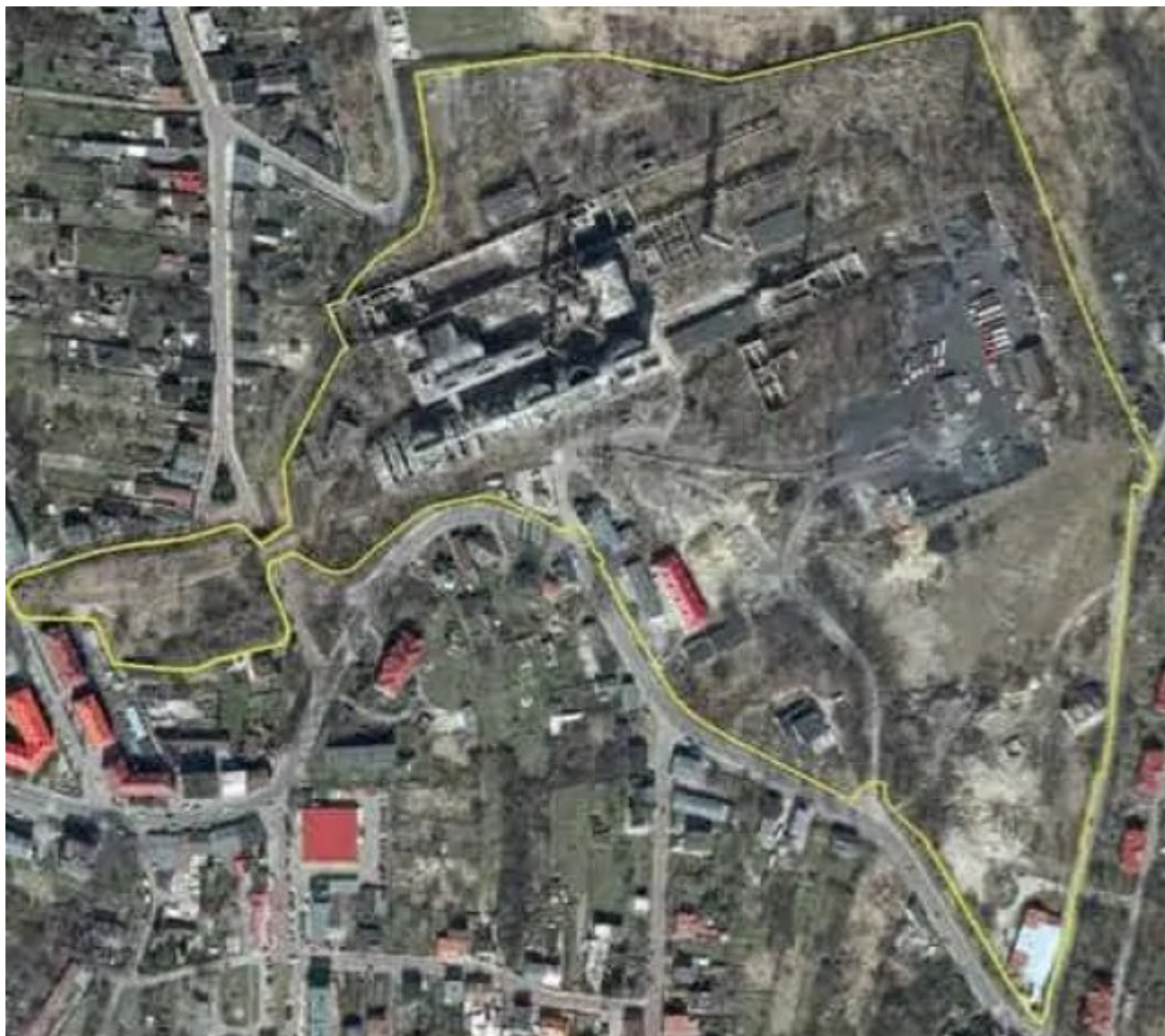
Teren byłej cementowni Grodziec.