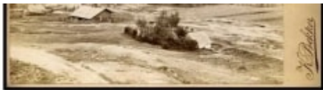
1. Zdjęcie: Początki z lat 1890-1900 przedstawiająca Cementownię „Grodziec”.