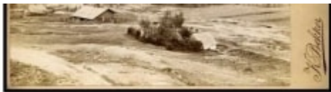
1. Zdjęcie: Początkowa z lat 1890-1900 przedstawiająca Cementownię „Grodziec”.