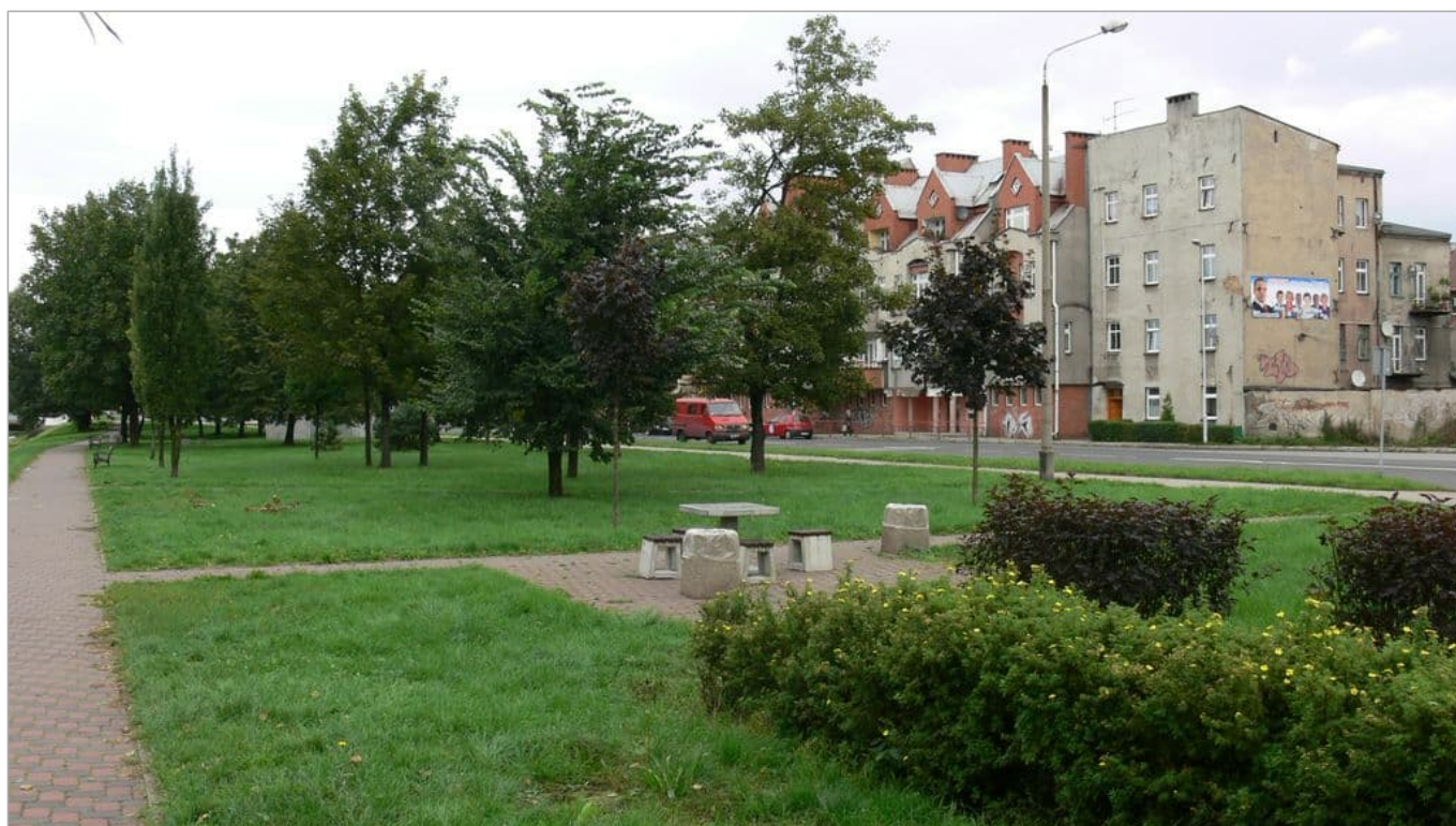
Zdjęcie 17 z 22