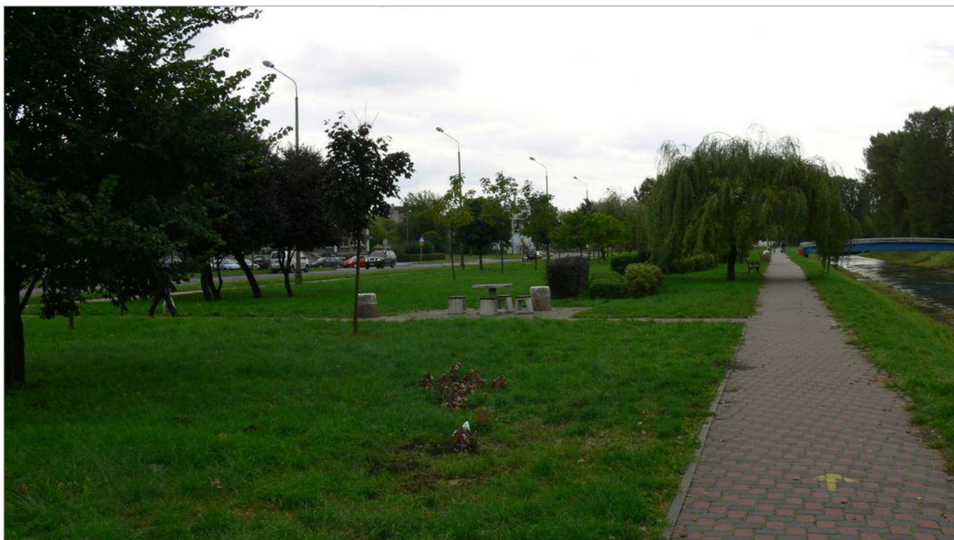
Zdjęcie 16 z 22