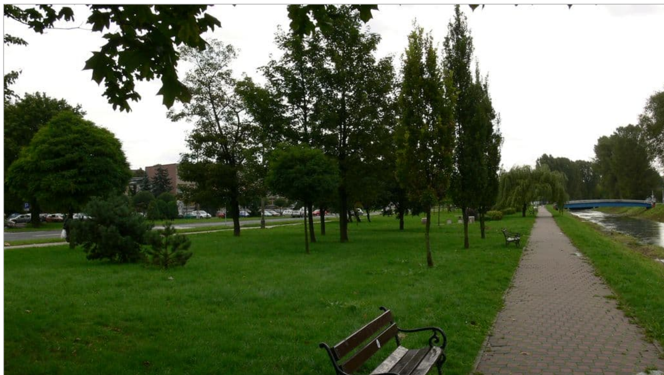
Zdjęcie 15 z 22