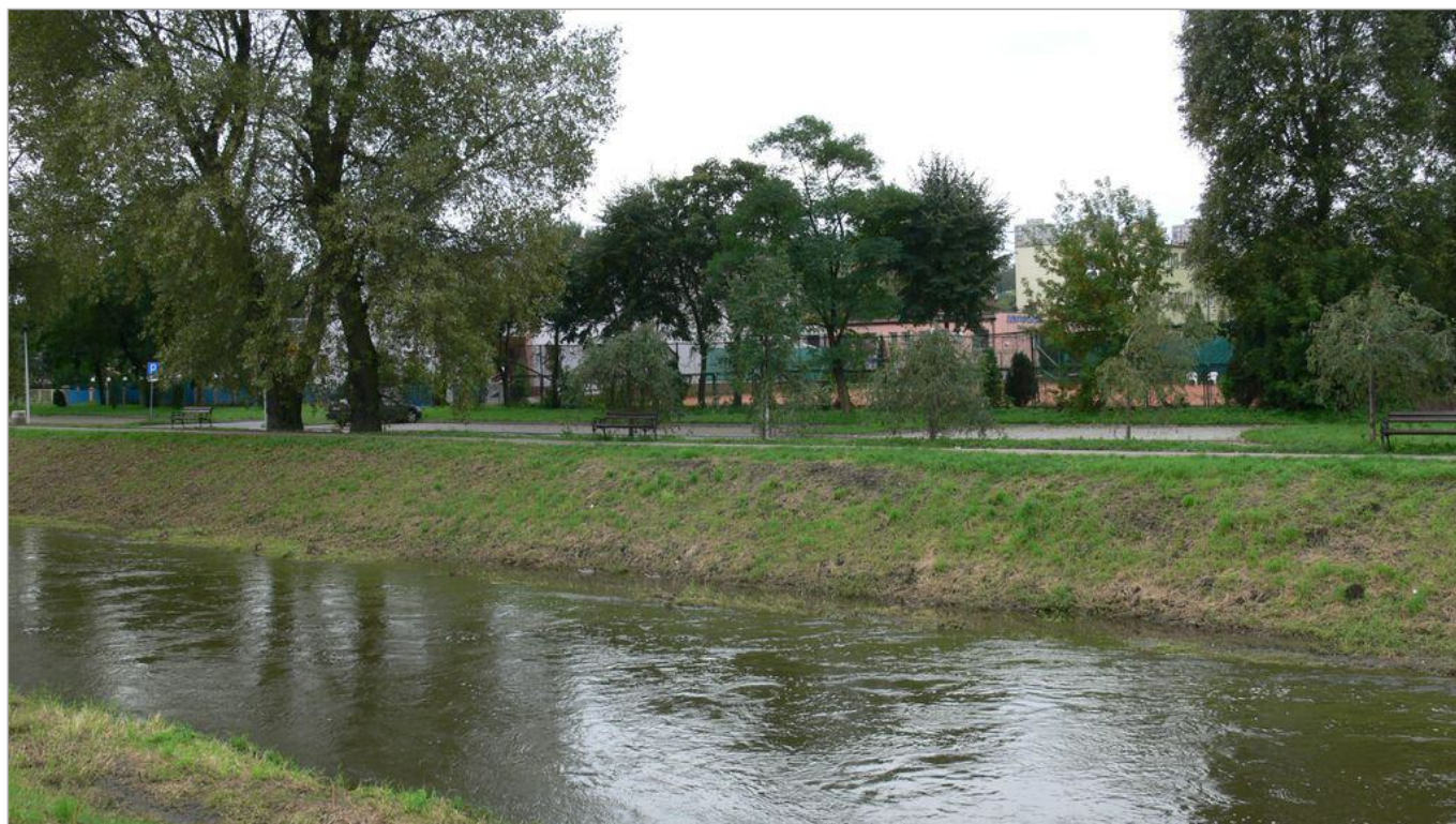
Zdjęcie 14 z 22