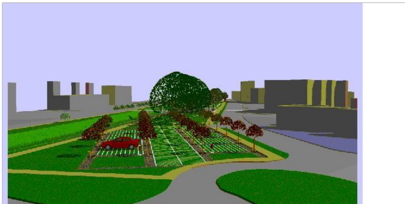
Zdjęcie 5 z 5