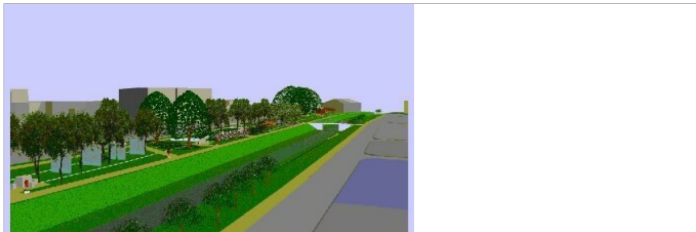
Zdjęcie 4 z 5