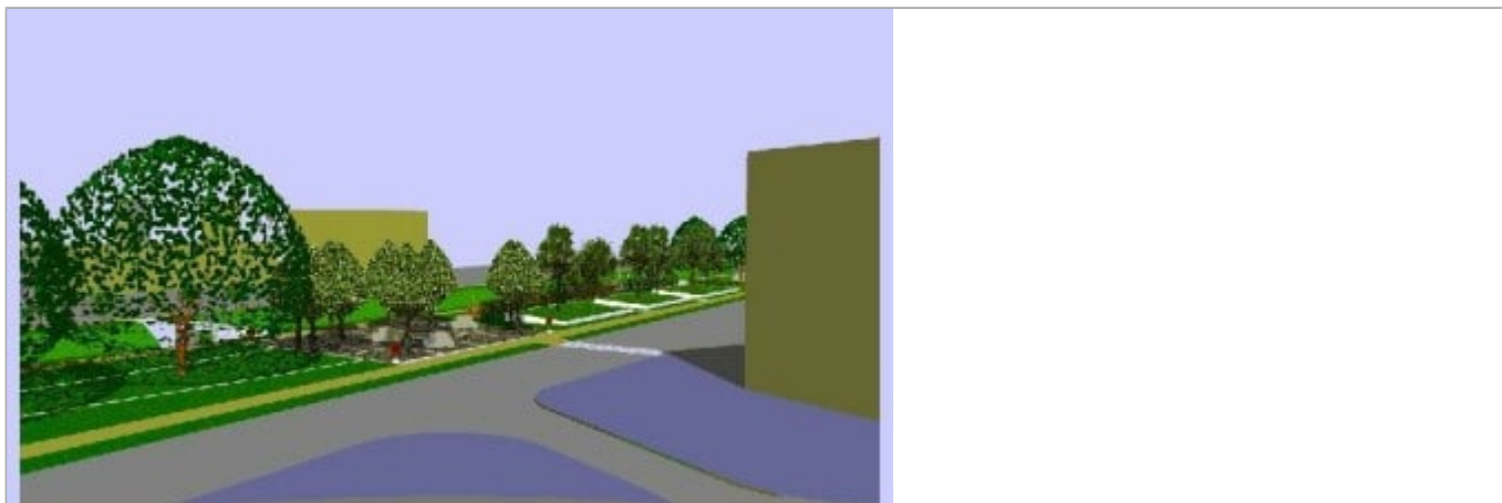
Zdjęcie 3 z 5