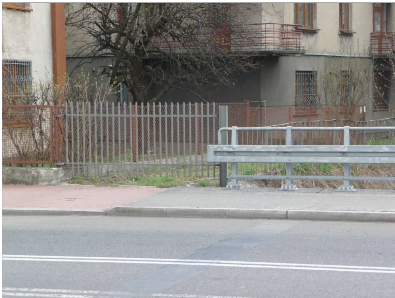
Zdjęcie 22 z 22