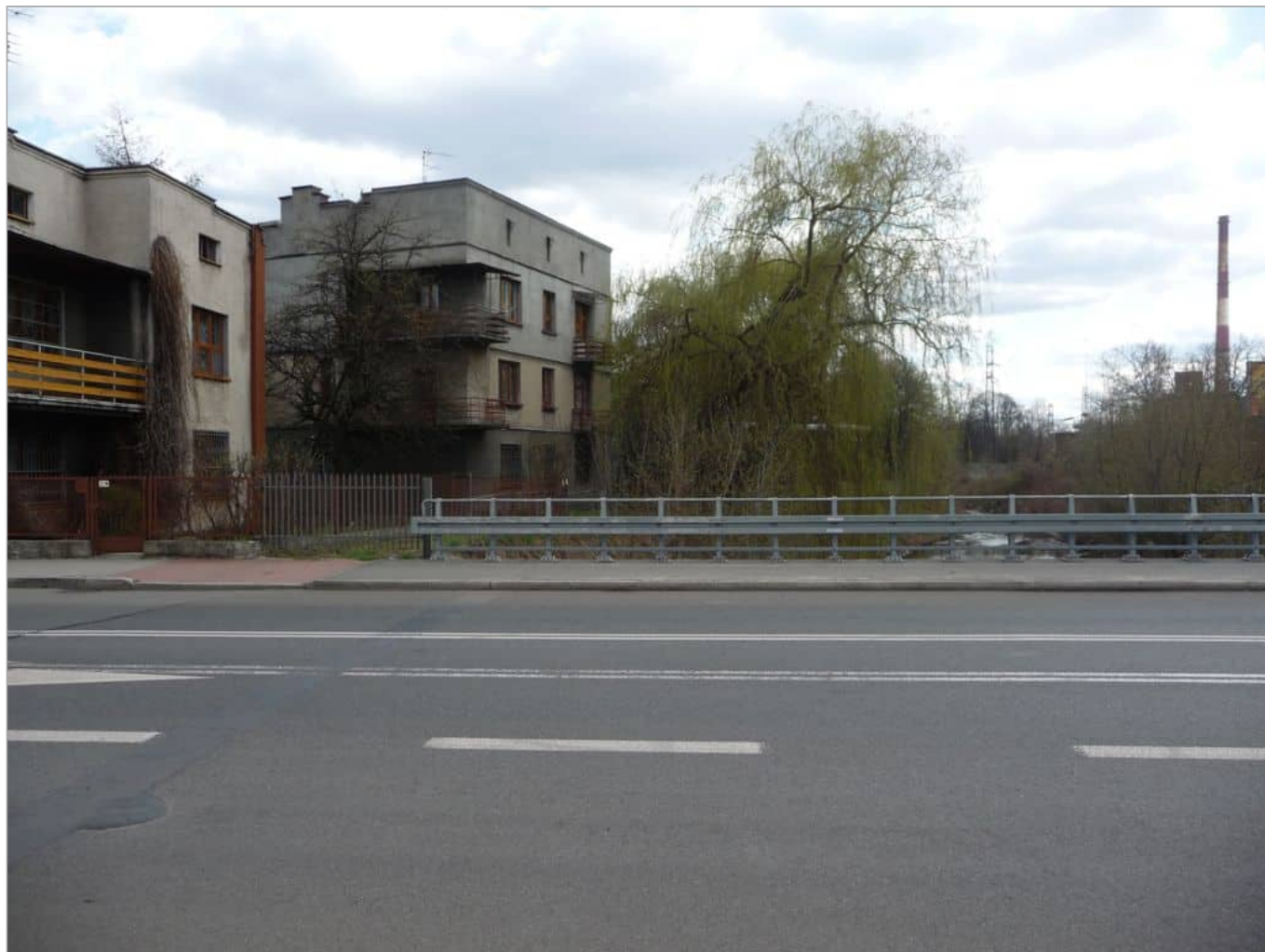
Zdjęcie 21 z 22