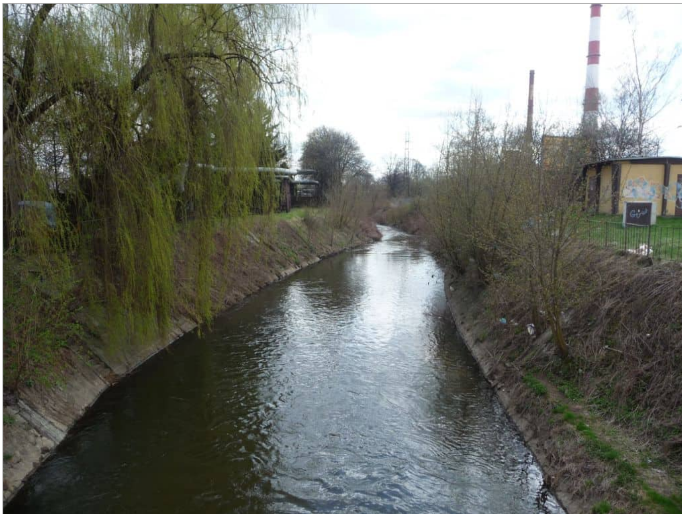
Zdjęcie 20 z 22