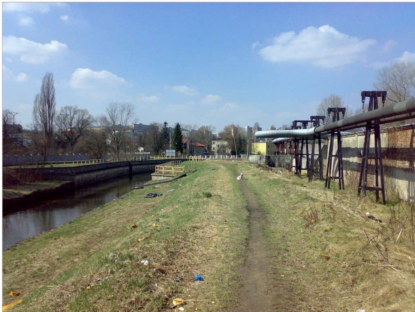
Zdjęcie 18 z 22