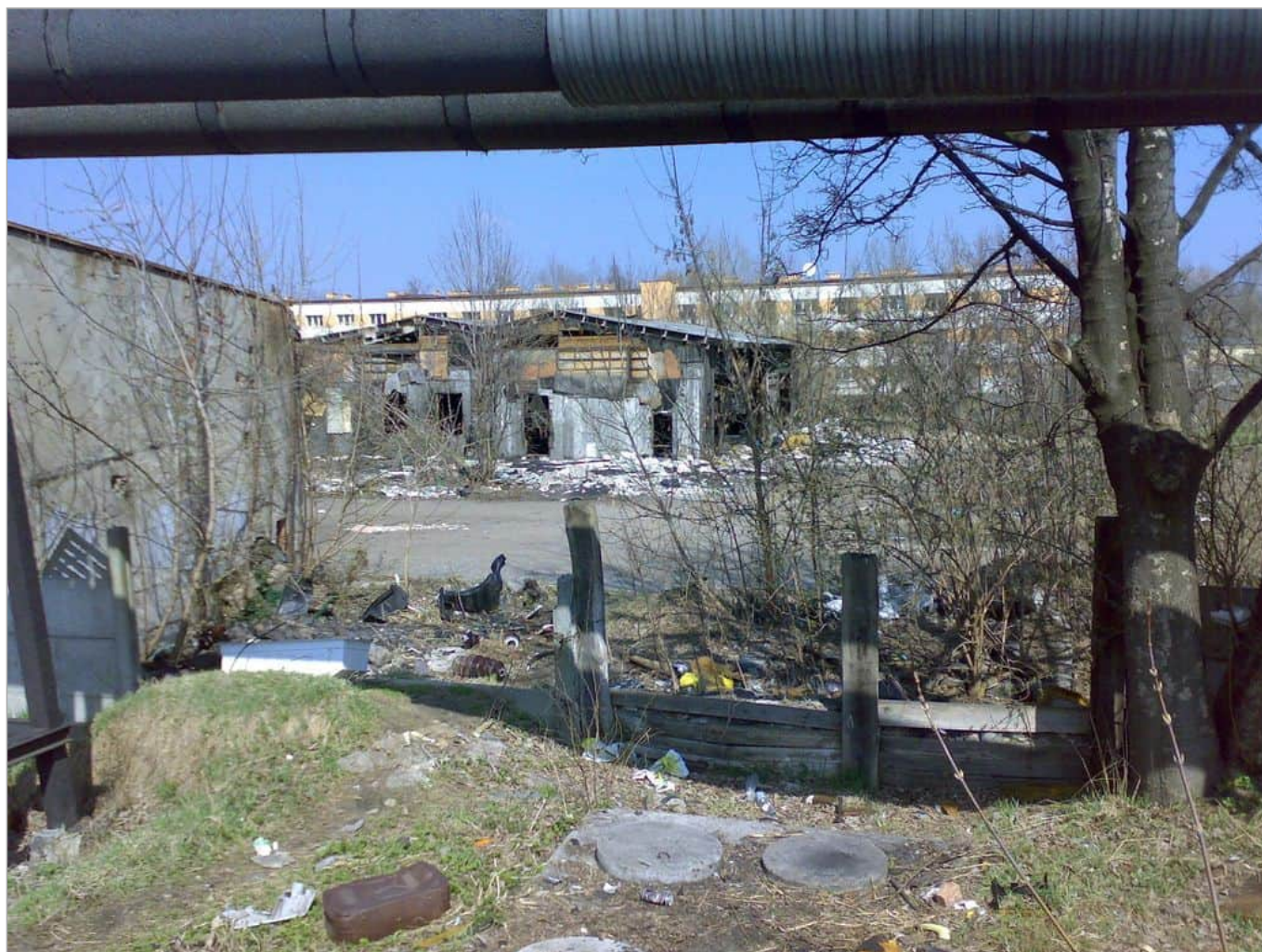
Zdjęcie 17 z 22