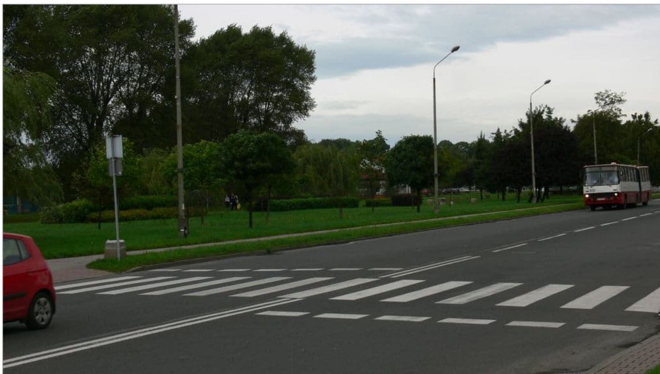
Zdjęcie 1 z 22