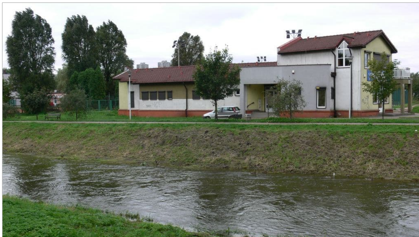
Zdjęcie 12 z 22