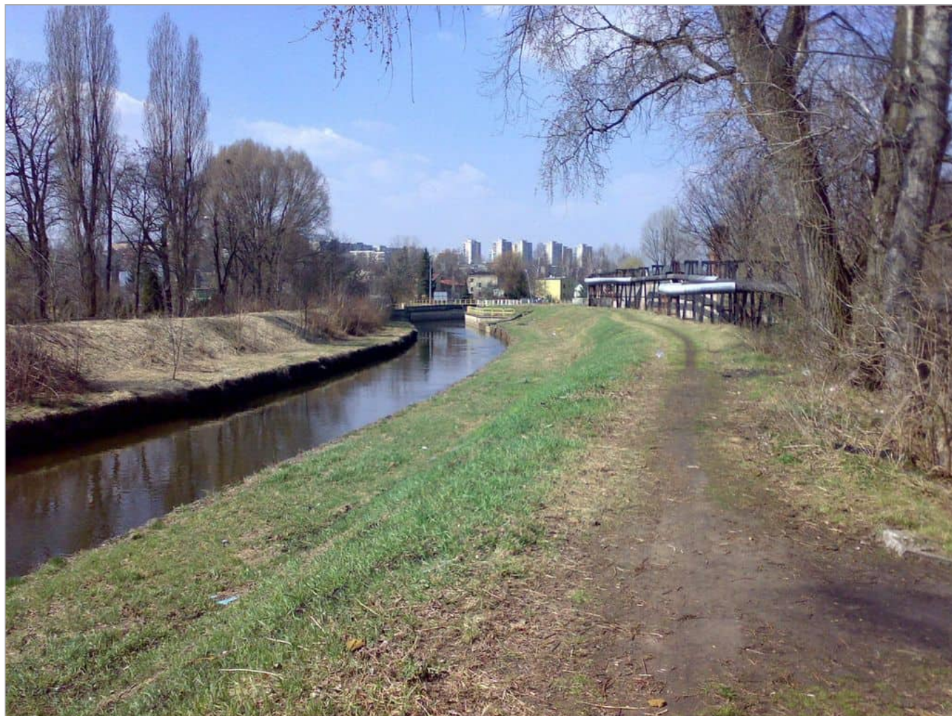
Zdjęcie 16 z 22