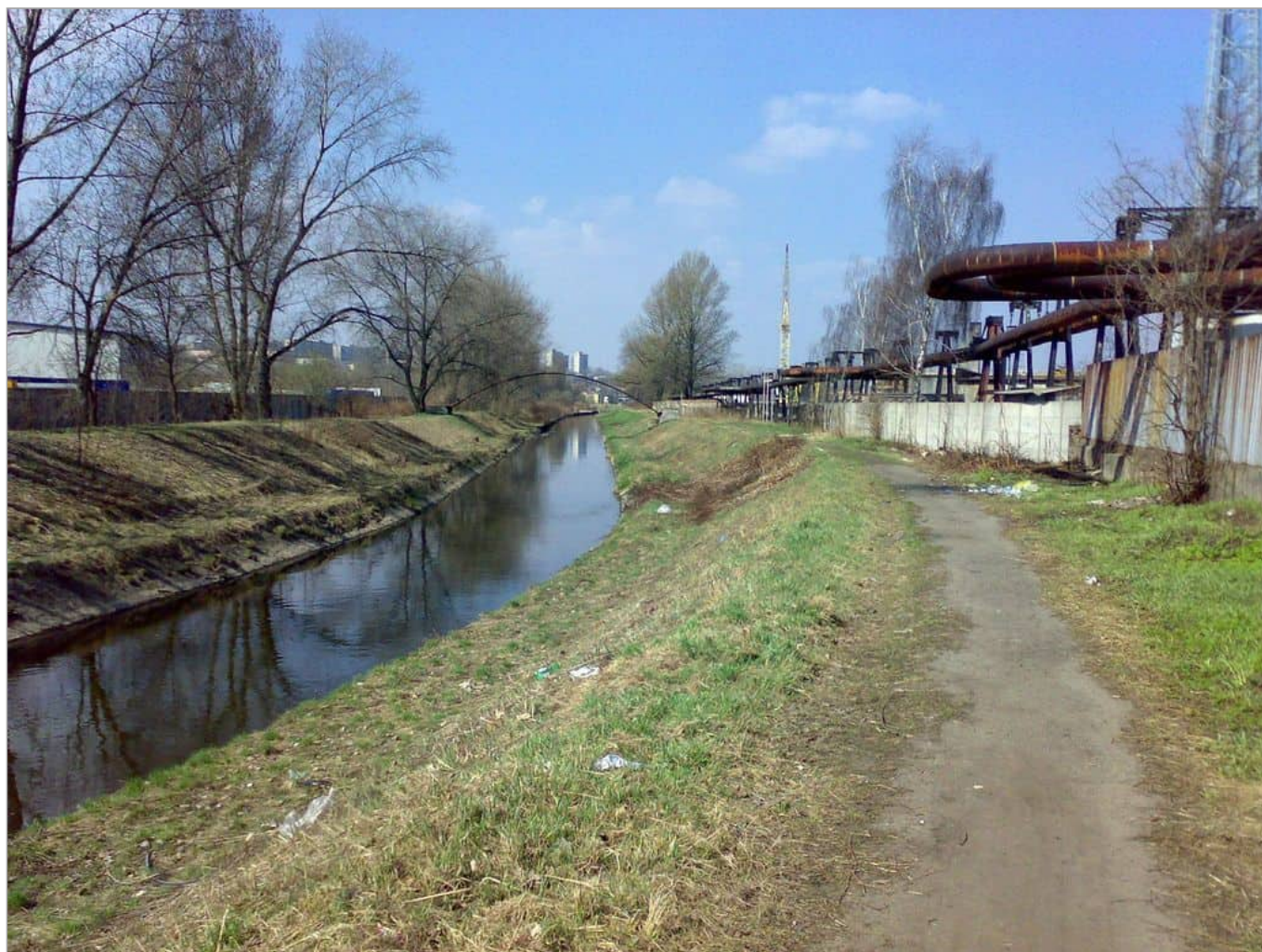
Zdjęcie 14 z 22