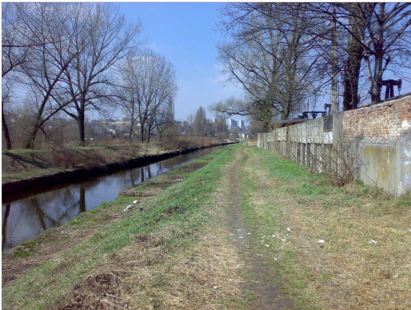
Zdjęcie 13 z 22