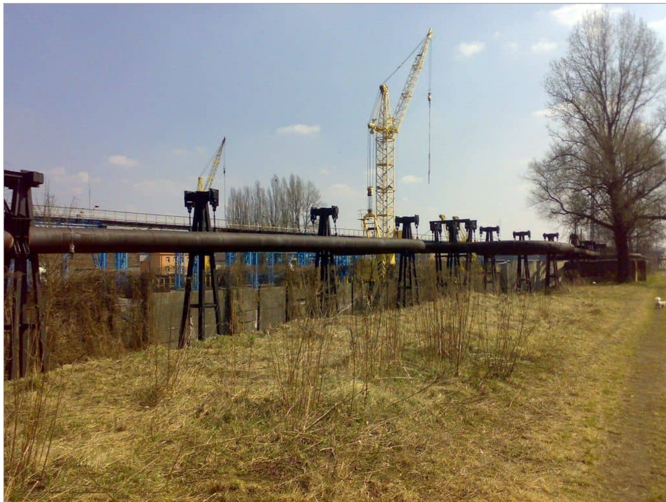
Zdjęcie 9 z 22