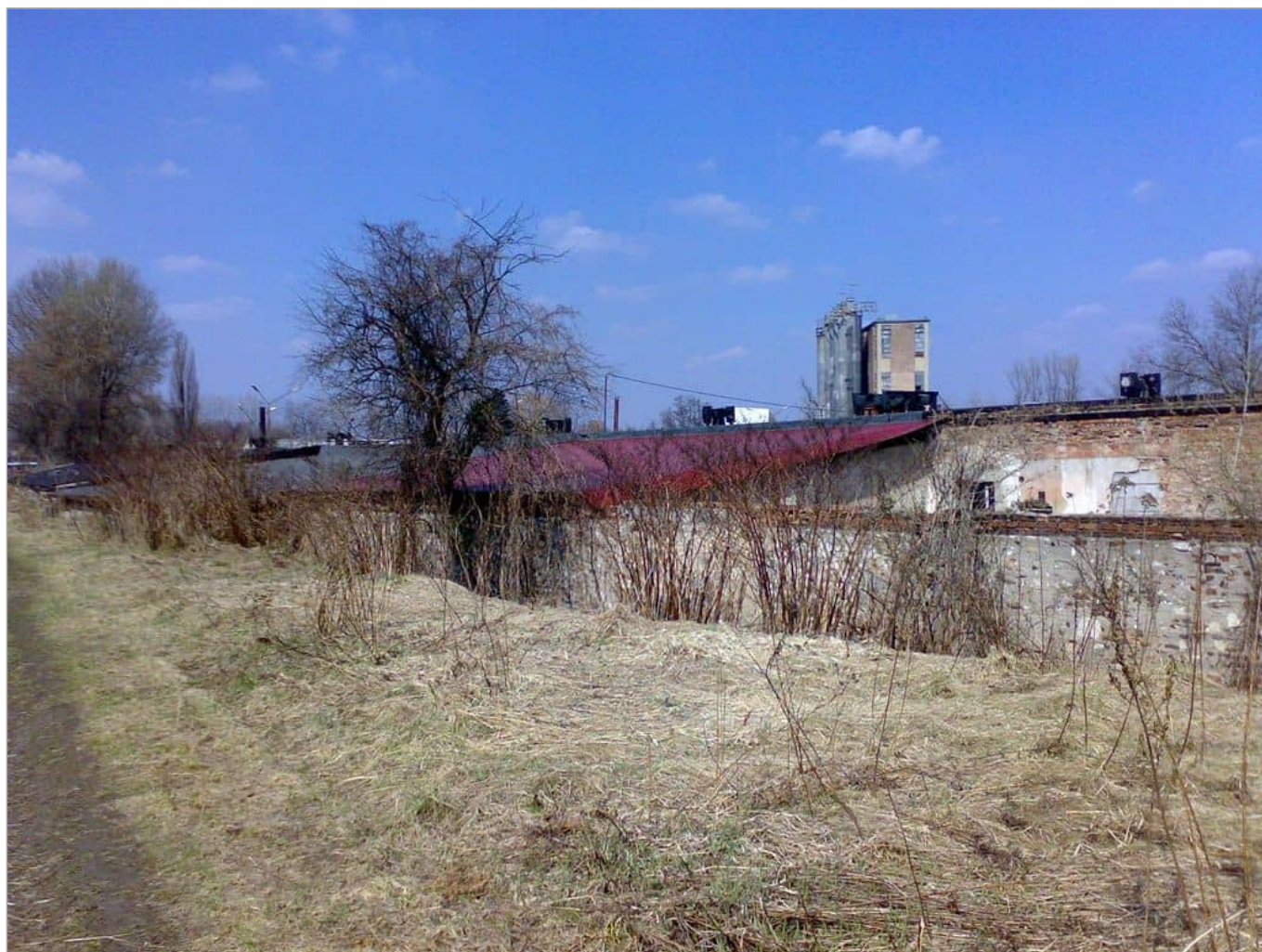
Zdjęcie 8 z 22