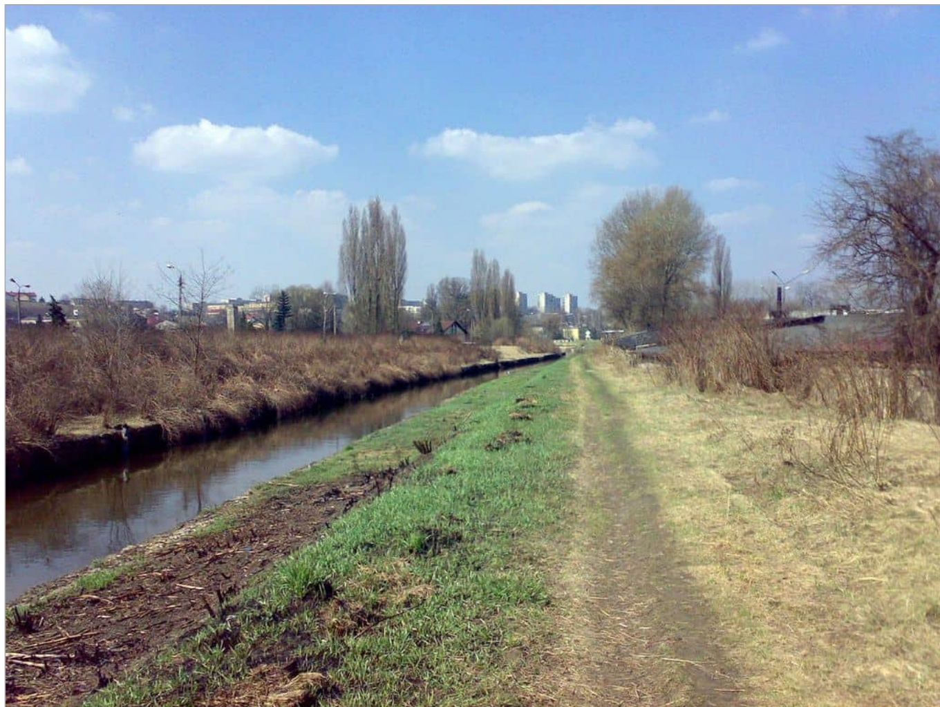
Zdjęcie 7 z 22