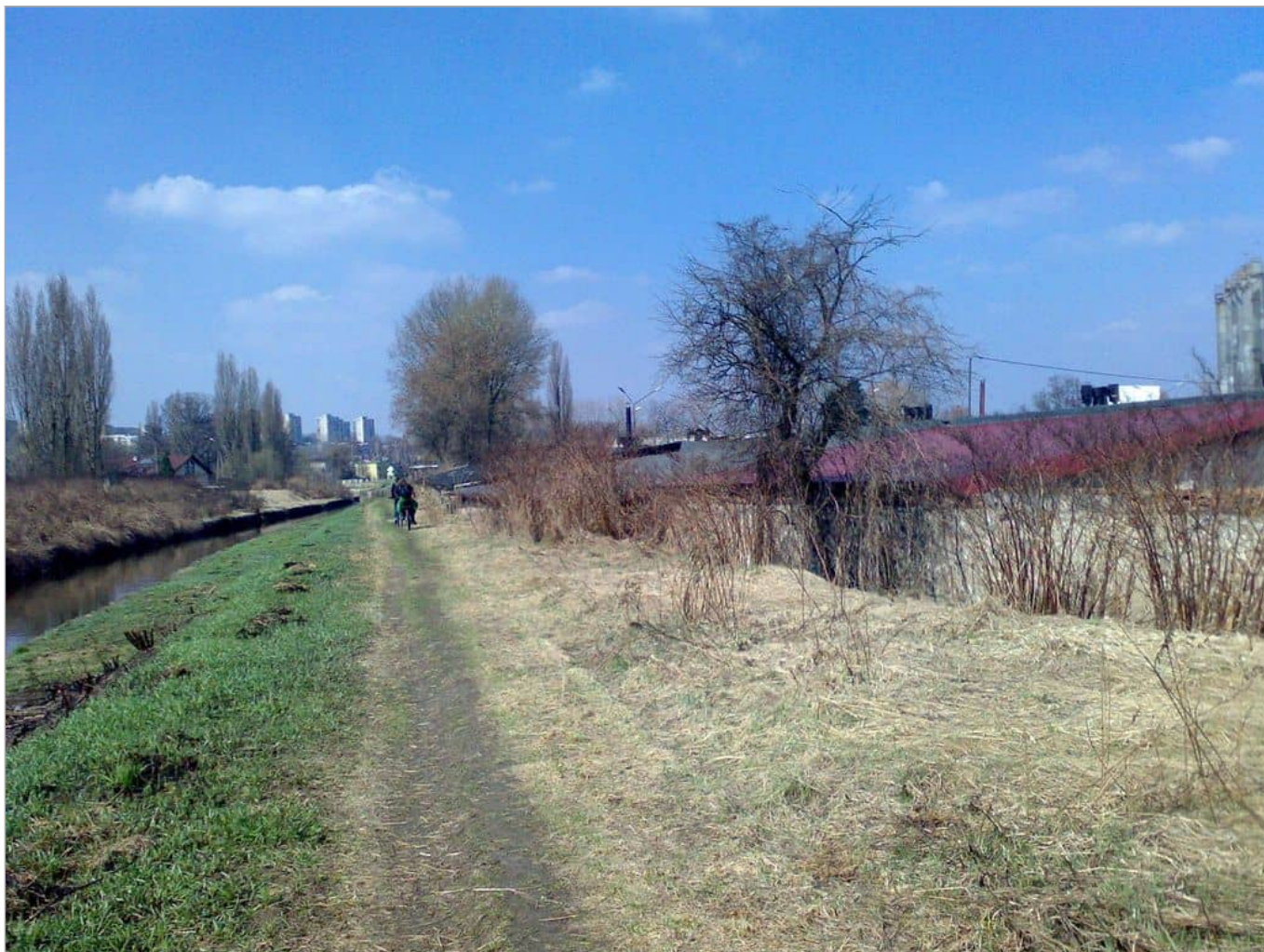
Zdjęcie 6 z 22