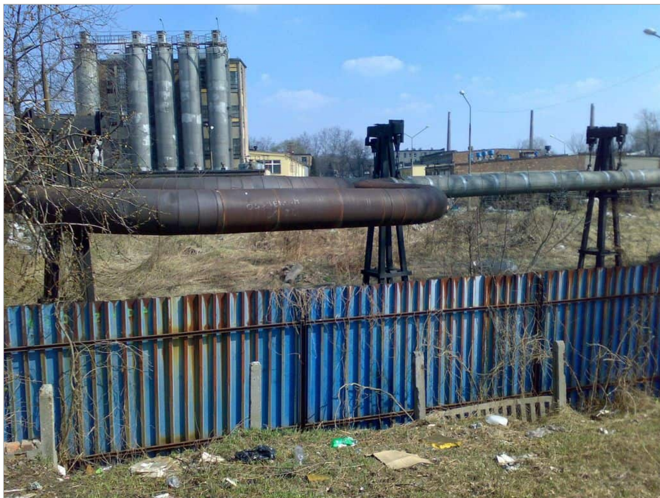
Zdjęcie 4 z 22