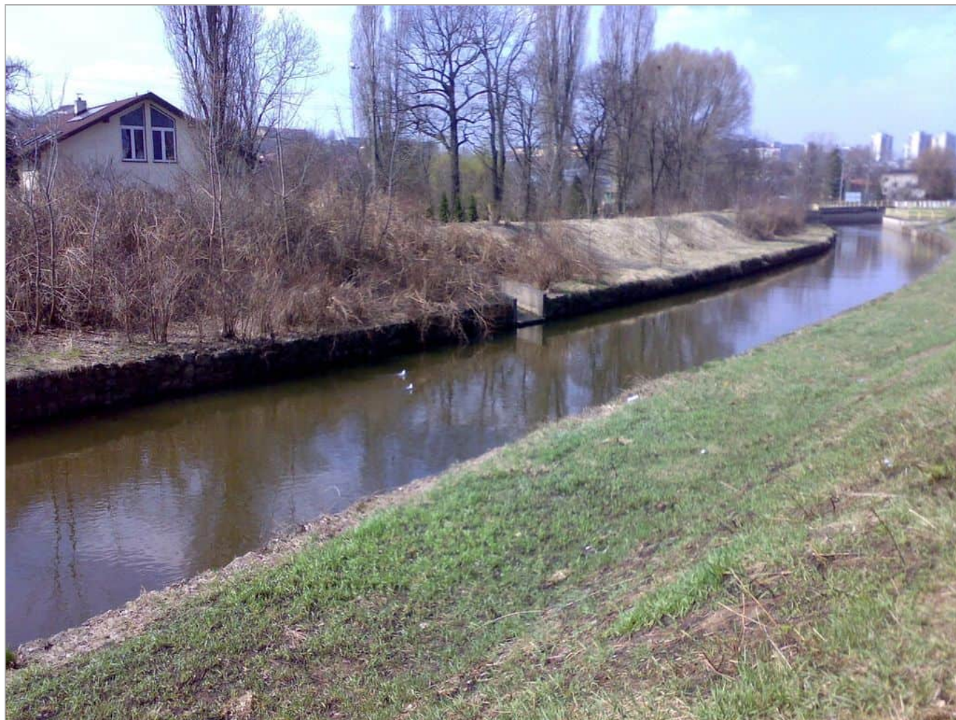
Zdjęcie 3 z 22