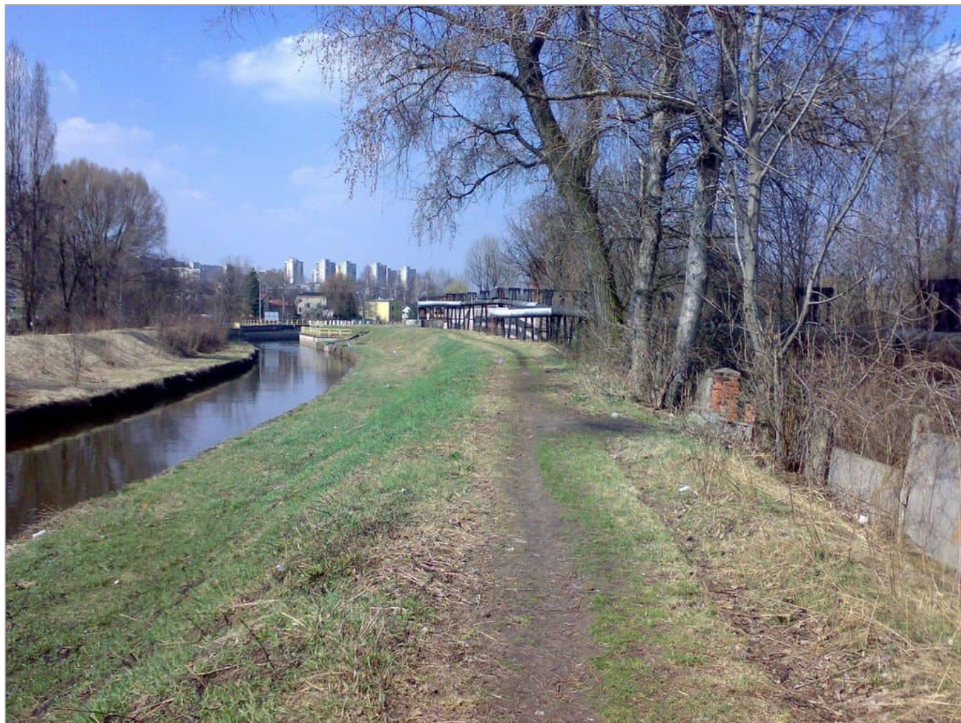
Zdjęcie 2 z 22