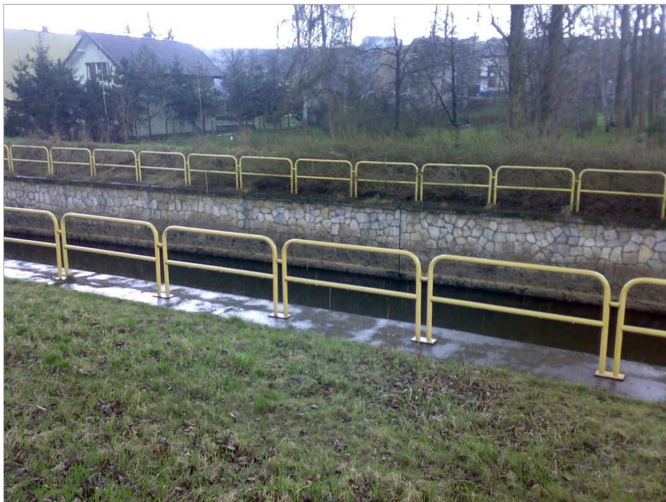
Zdjęcie 10 z 11