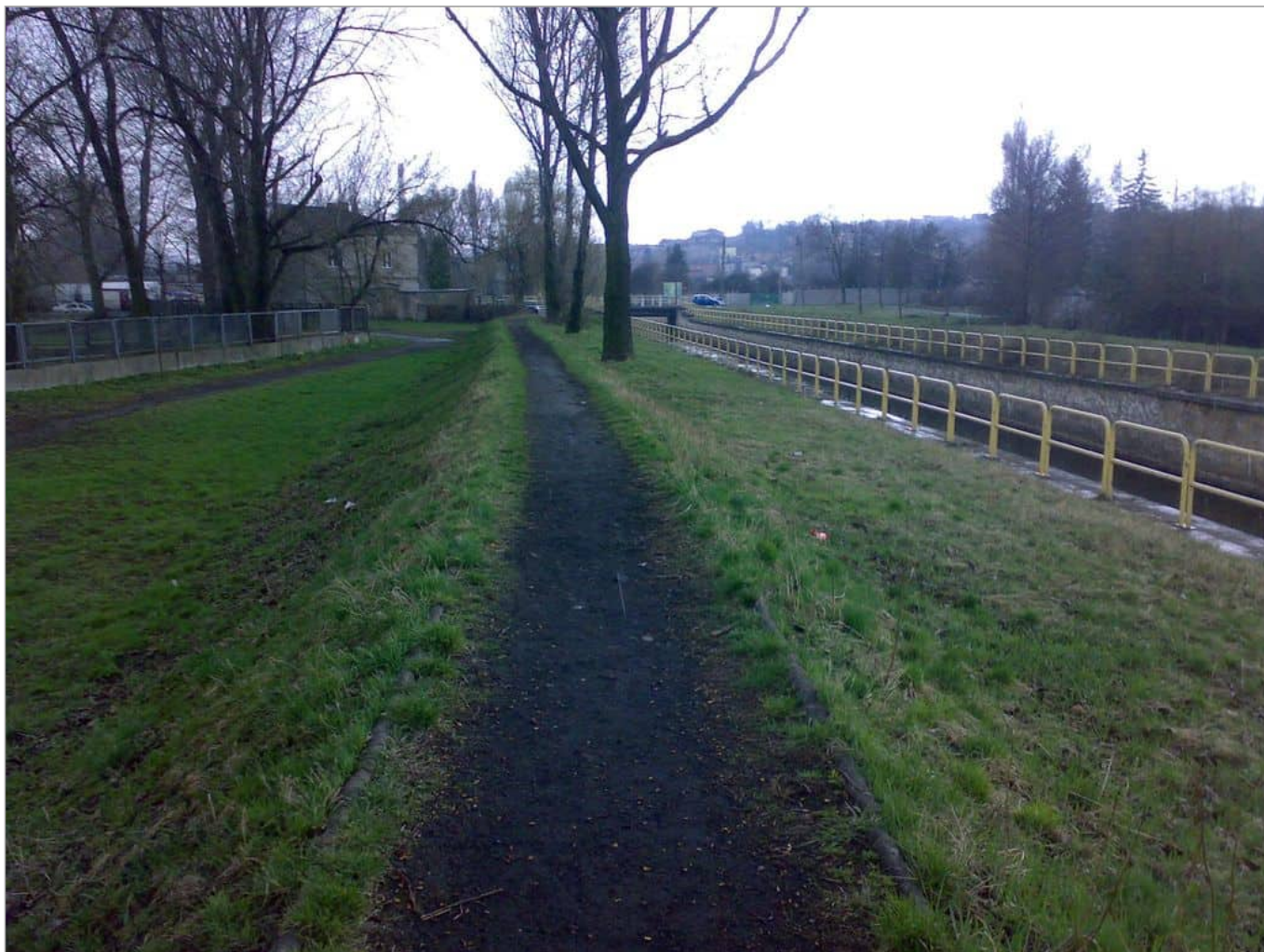
Zdjęcie 9 z 11