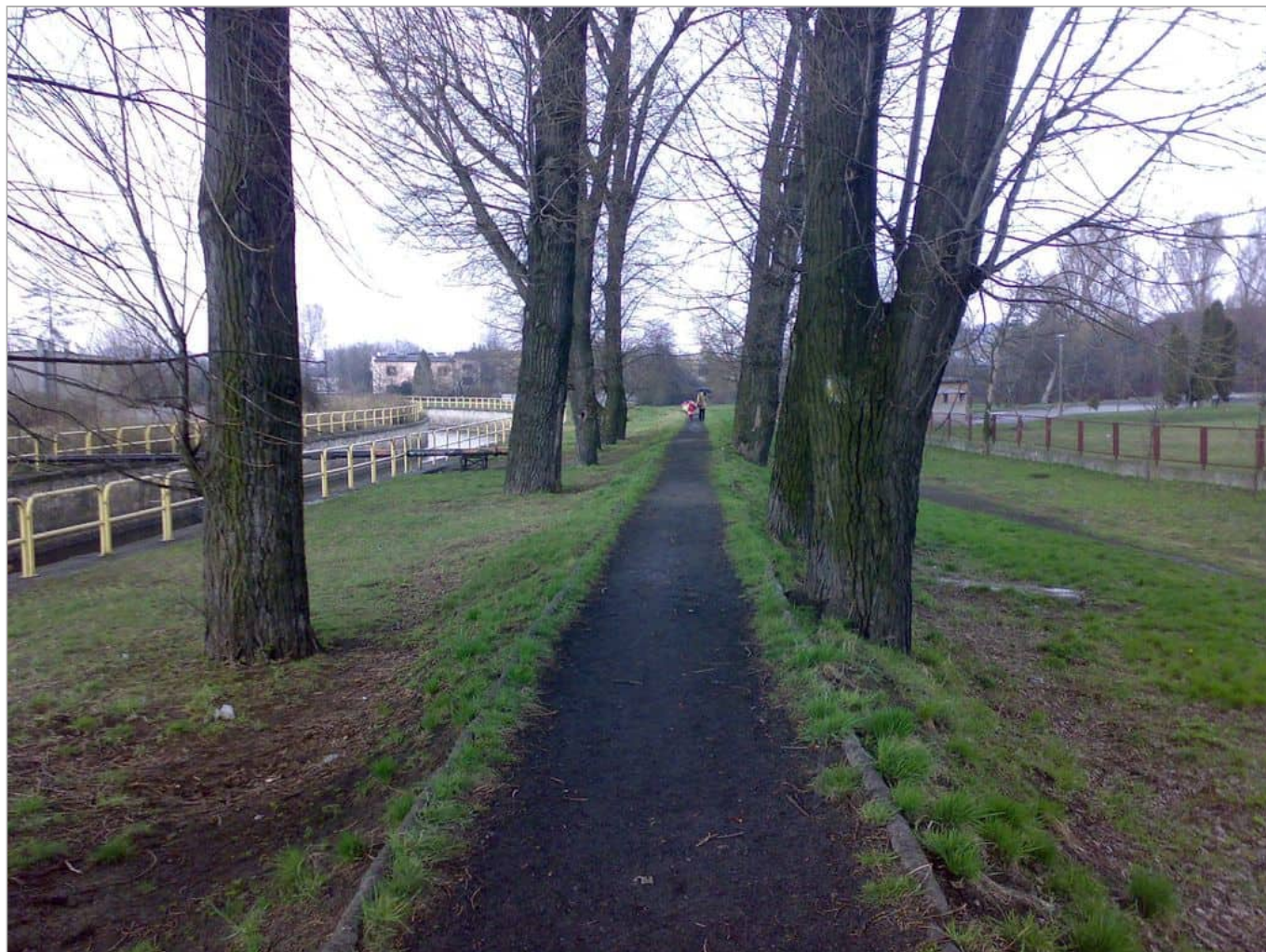
Zdjęcie 8 z 11