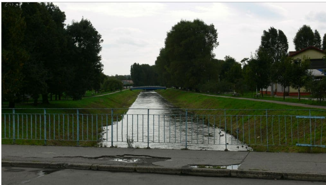
Zdjęcie 10 z 22