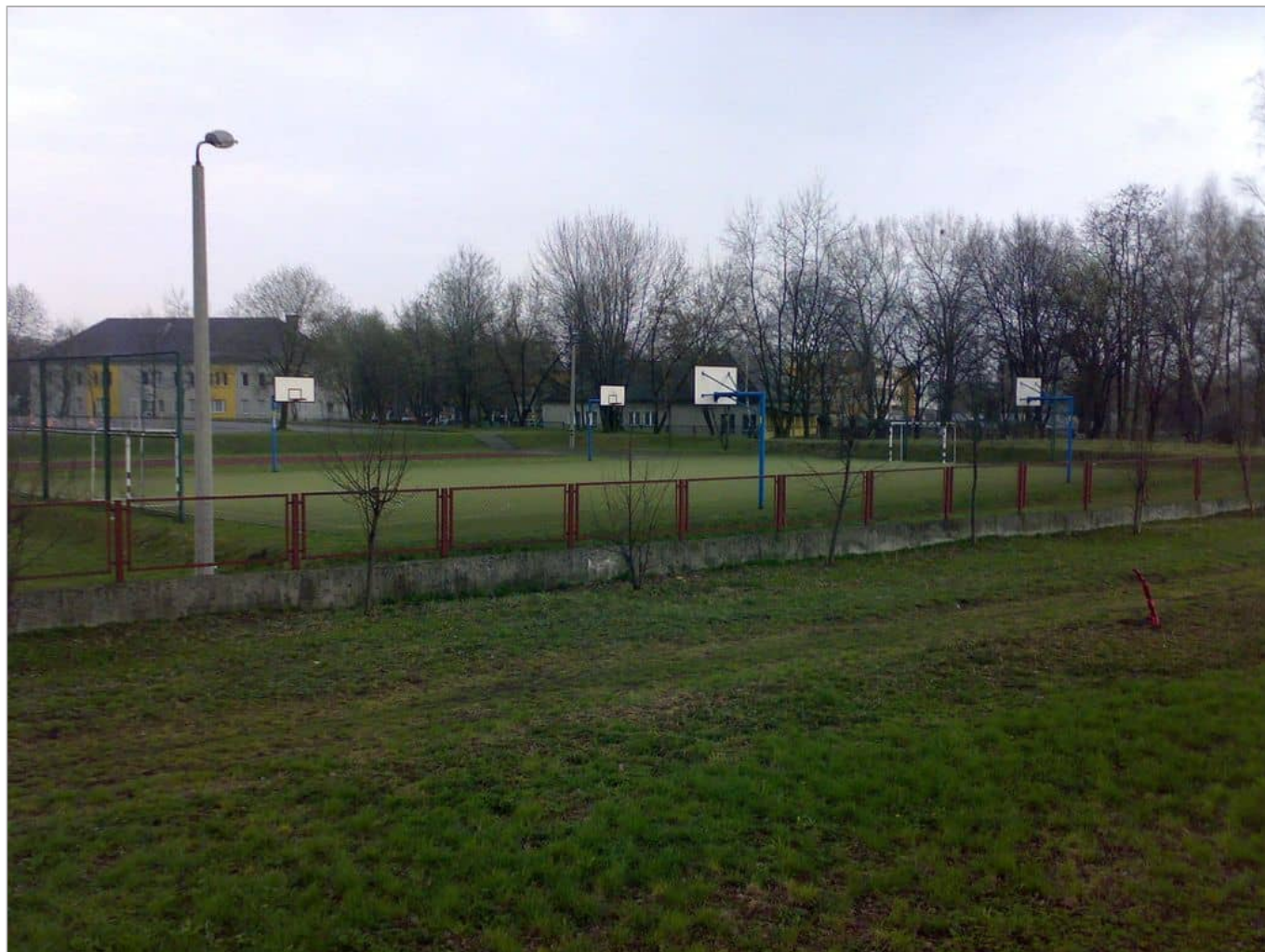
Zdjęcie 7 z 11