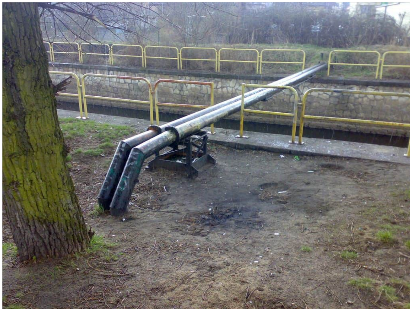
Zdjęcie 6 z 11