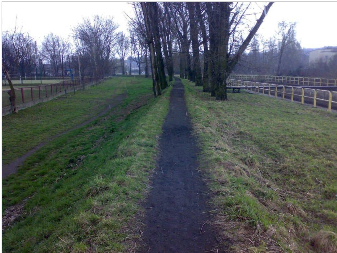
Zdjęcie 5 z 11