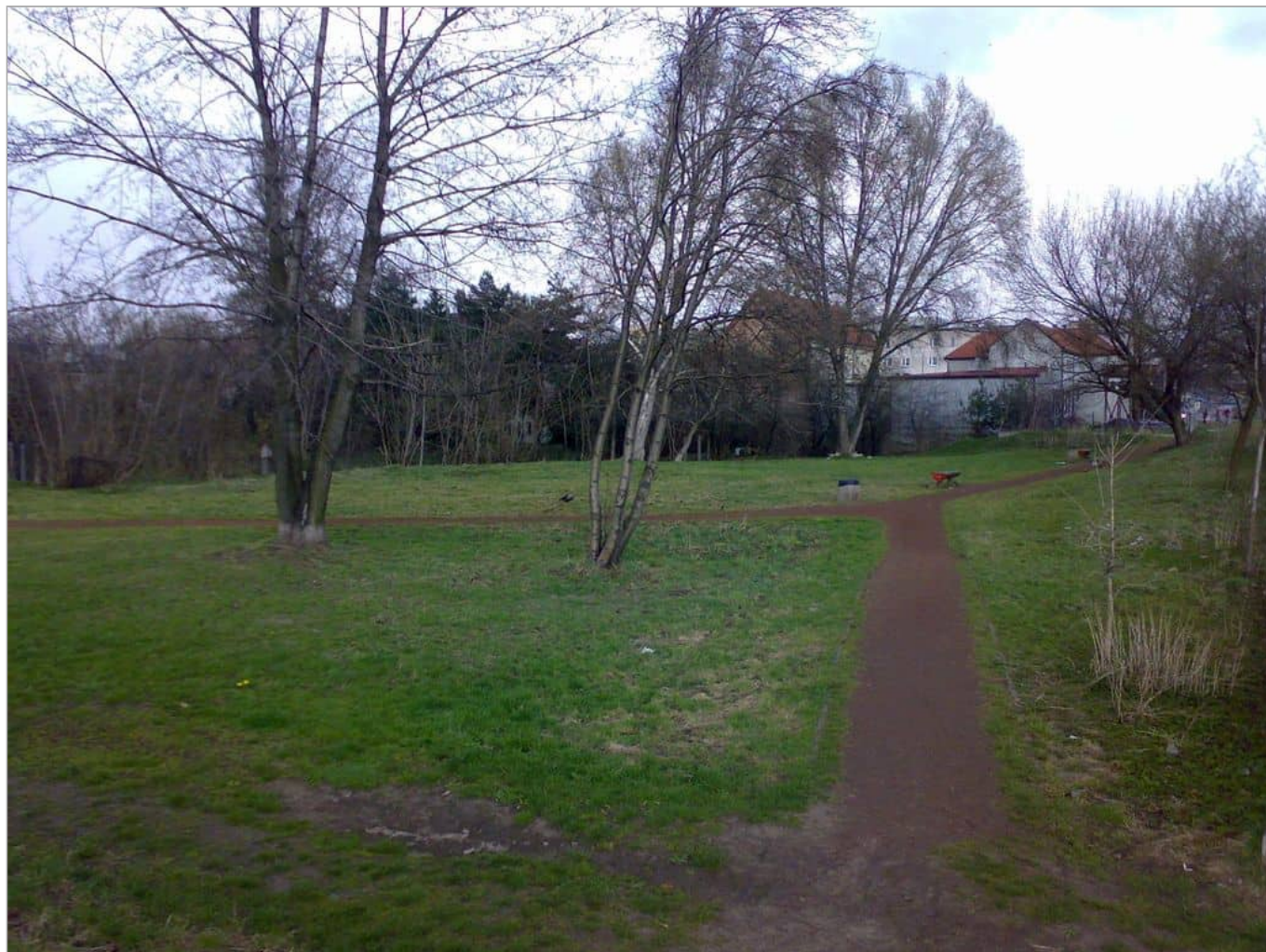
Zdjęcie 4 z 11