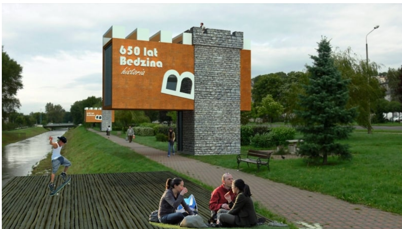
Pawilon historii_UNREAL 12

przychód do kasy miasta. Przecież wzdłuż bulwarów aż prosi się o kilka pawilonów gastronomicznych, herbaciarnię, toaletę publiczną, może i jakieś moło drewniane, scenę artystyczną, fontanny które zimą mogłyby służyć jako mini lodowiska czy choćby kilka całosezonowych placów zabaw. Wszystko to można by połączyć z kioskami promującymi miasto, takimi jakie są obecne już dziś wszędzie w Europie Zachodniej. Może udałoby się przenieść festiwal celtycki wzdłuż rzeki i połączyć go z kupieckim jarmarkiem. Morze życzeń... ale na dzień dzisiejszy nad rzekę nie ma niestety po co przychodzić. Władze miasta muszą zdawać sobie sprawę, że przywracanie miastu rzeki to długotrwały proces wymagający konsekwentnego prawa i wizji, ale zagospodarowanie w prosty i sensowny sposób bulwarów nadrzecznych ma szansę znacznie przyspieszyć ten długotrwały proces. Poniżej zamieszczam mój luźny pomysł na pawilon promujący Będzin, który mógłby się stać jednym z elementów wypełniających monotonną przestrzeń nadrzeczną.