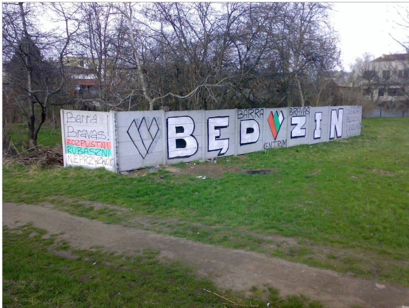
Zdjęcie 3 z 11