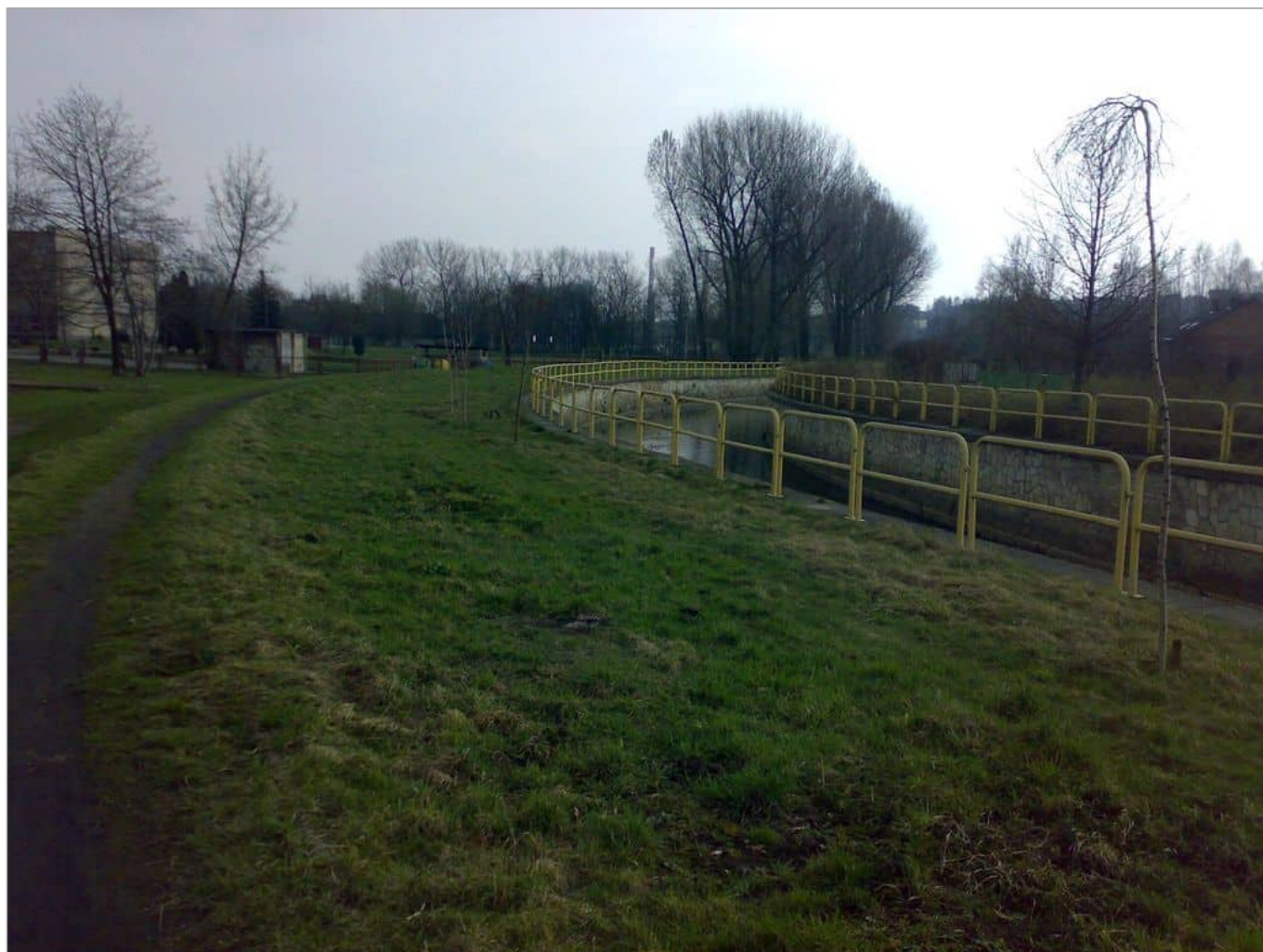
Zdjęcie 2 z 11