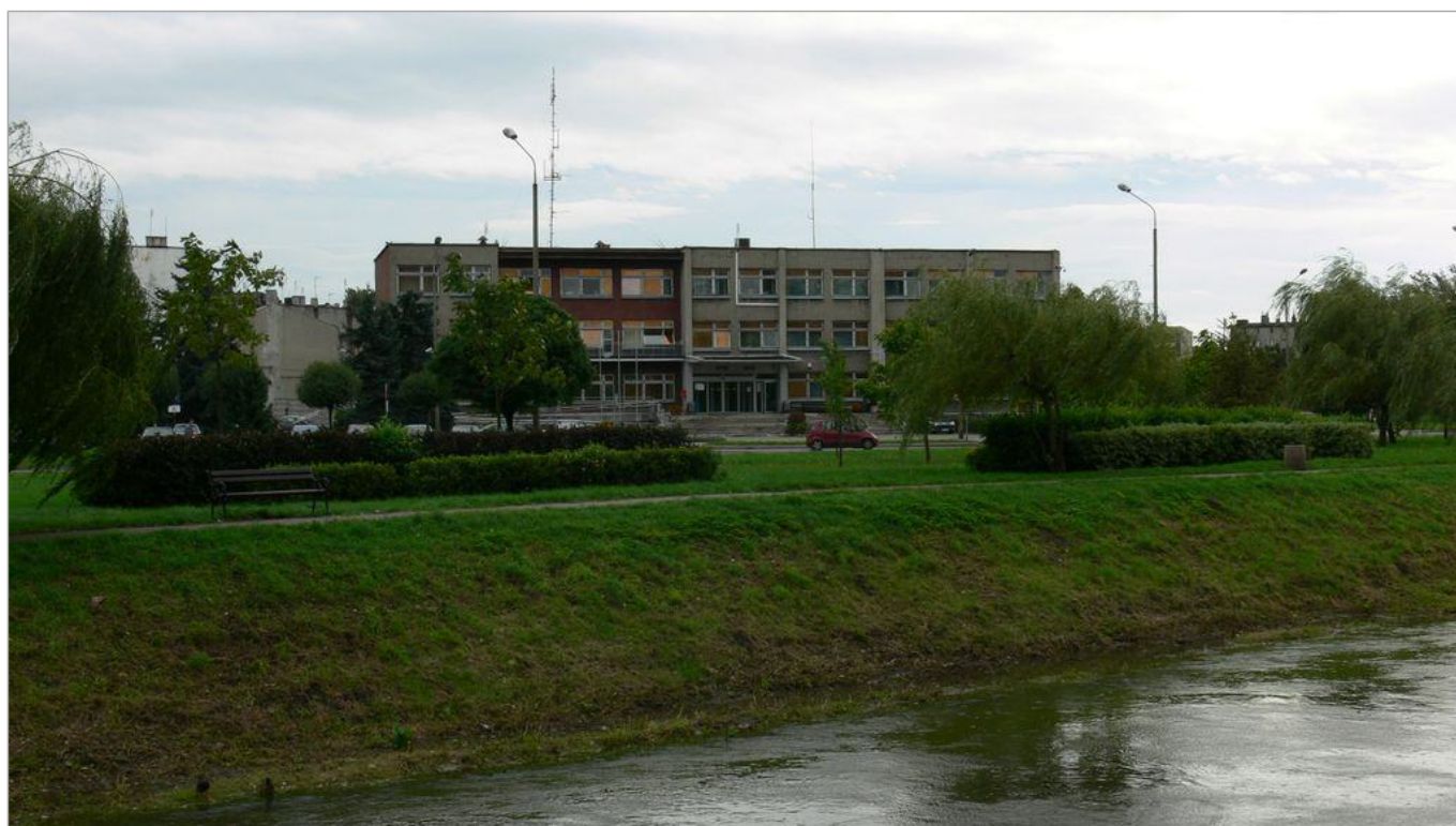
Zdjęcie 6 z 22