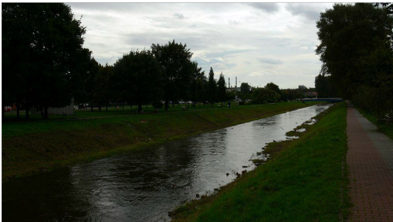
Zdjęcie 9 z 22