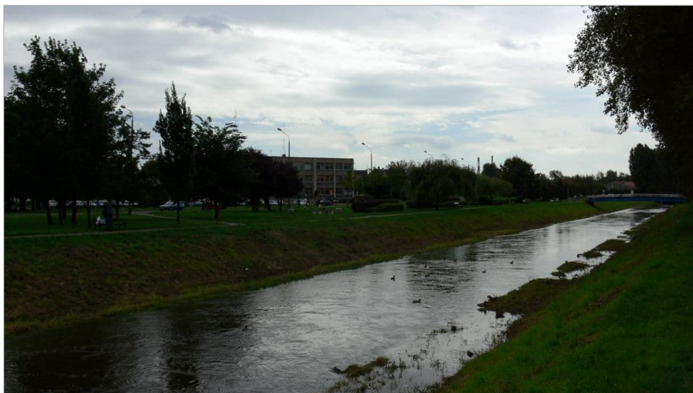
Zdjęcie 8 z 22