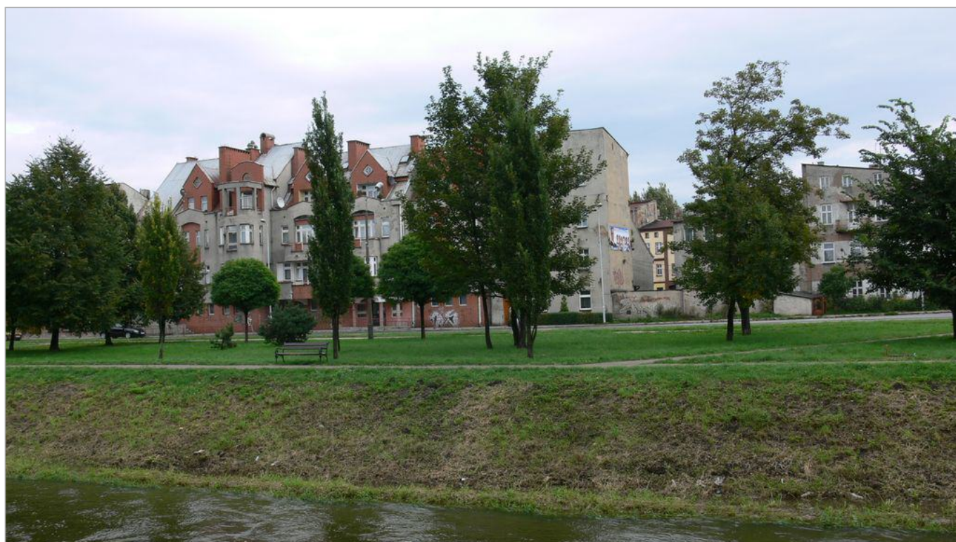
Zdjęcie 7 z 22