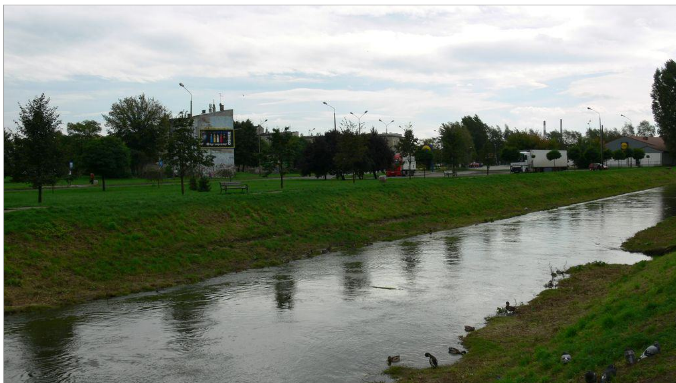
Zdjęcie 5 z 22